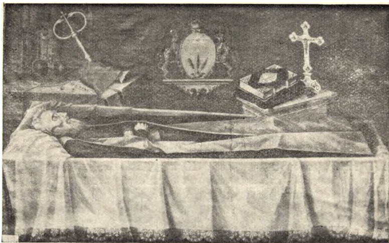
Еп. М. Ольшавський на смертній постелі. Портрет виготовлений у Мукачеві, зараз після смерті єпископа.