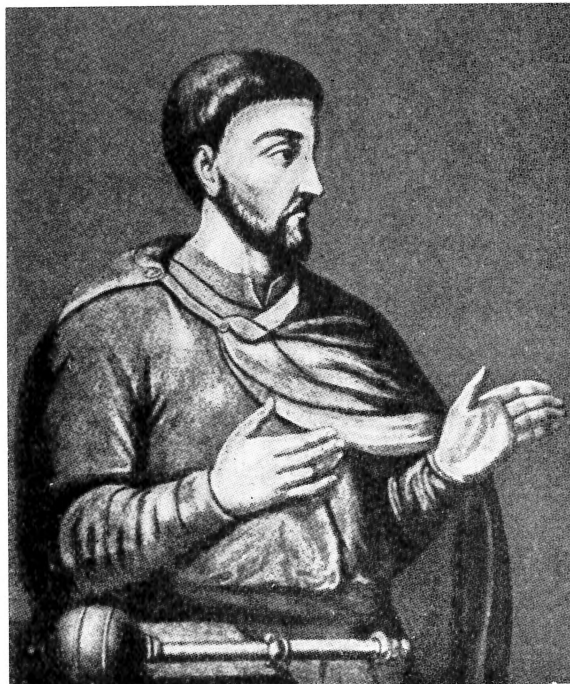
D. MNOHOHRIŠNYJ (1669-1672)