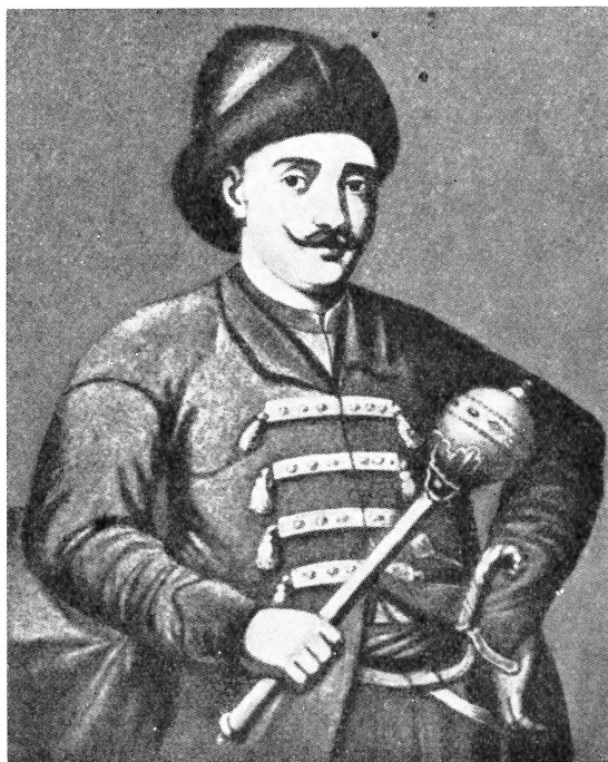
P. DOROŠENKO (1665-1676)