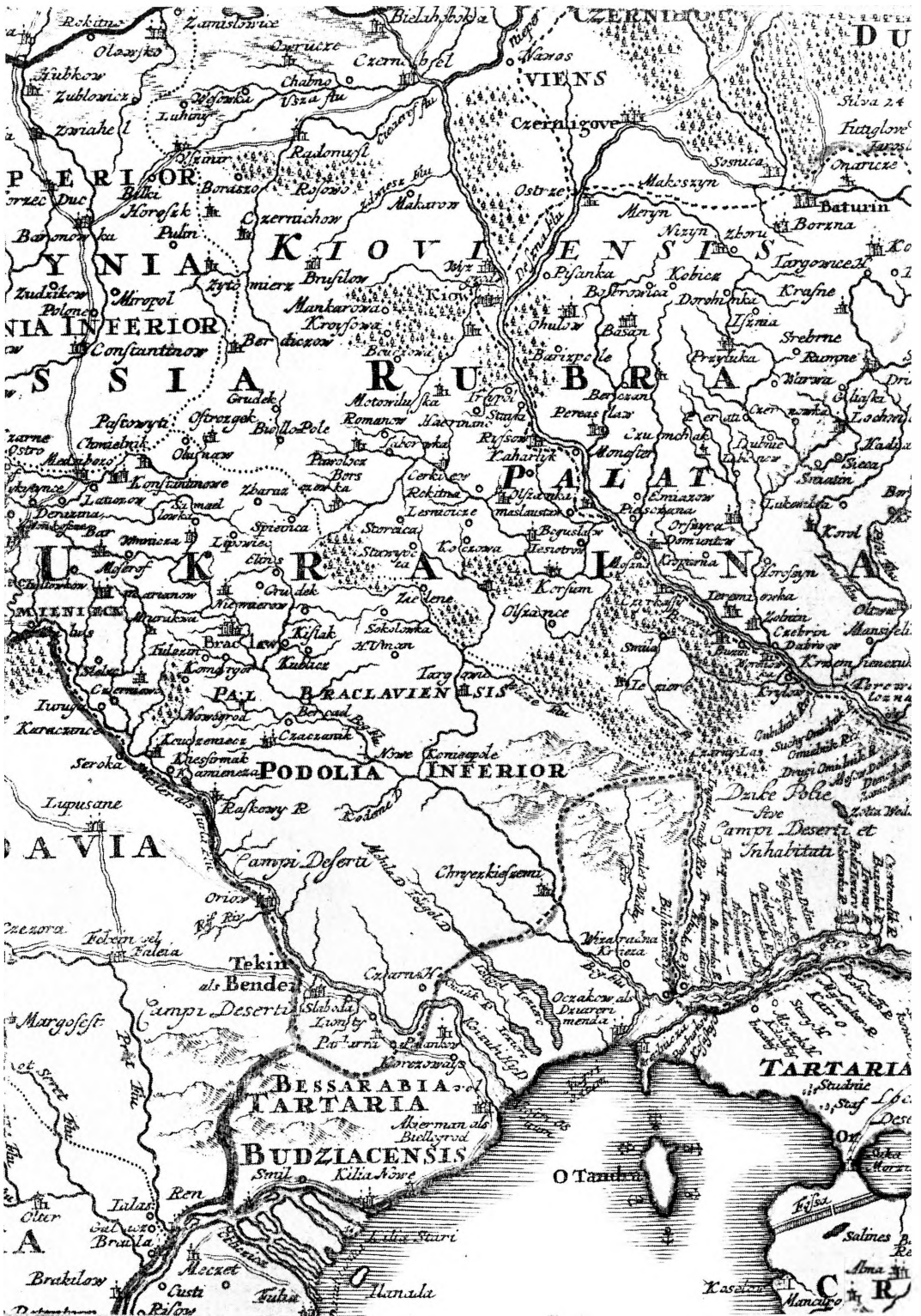
Ucrainae pars: Palatinatus Kioviensis