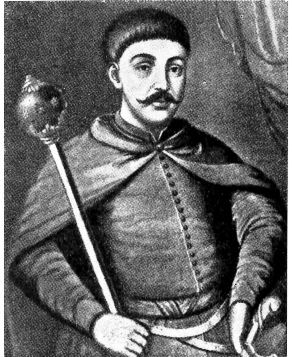
G. CHMELNYCKYJ (1660-1663)