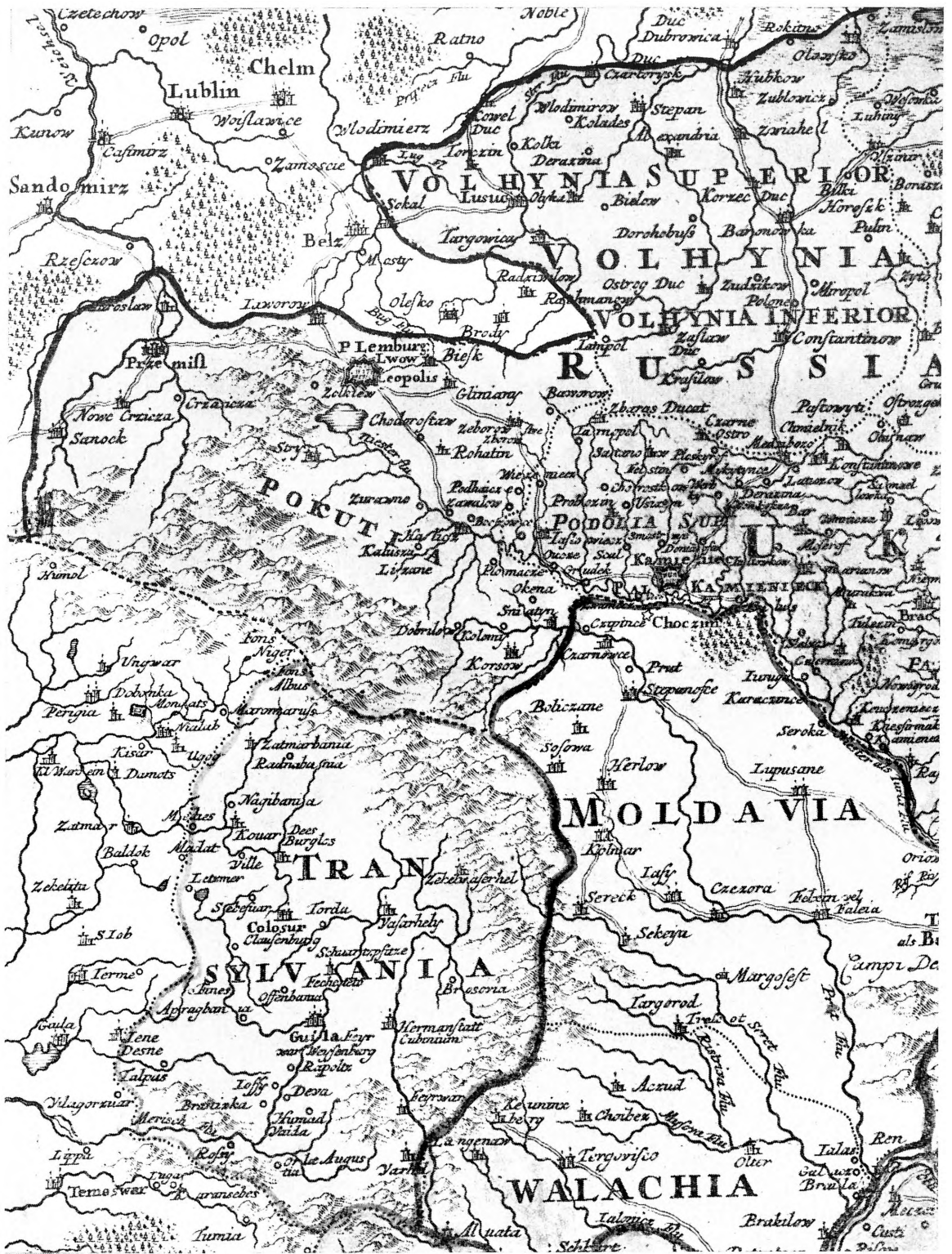
Ucrainae pars: Wolhynia, Palatinatus Russiae, Podolia