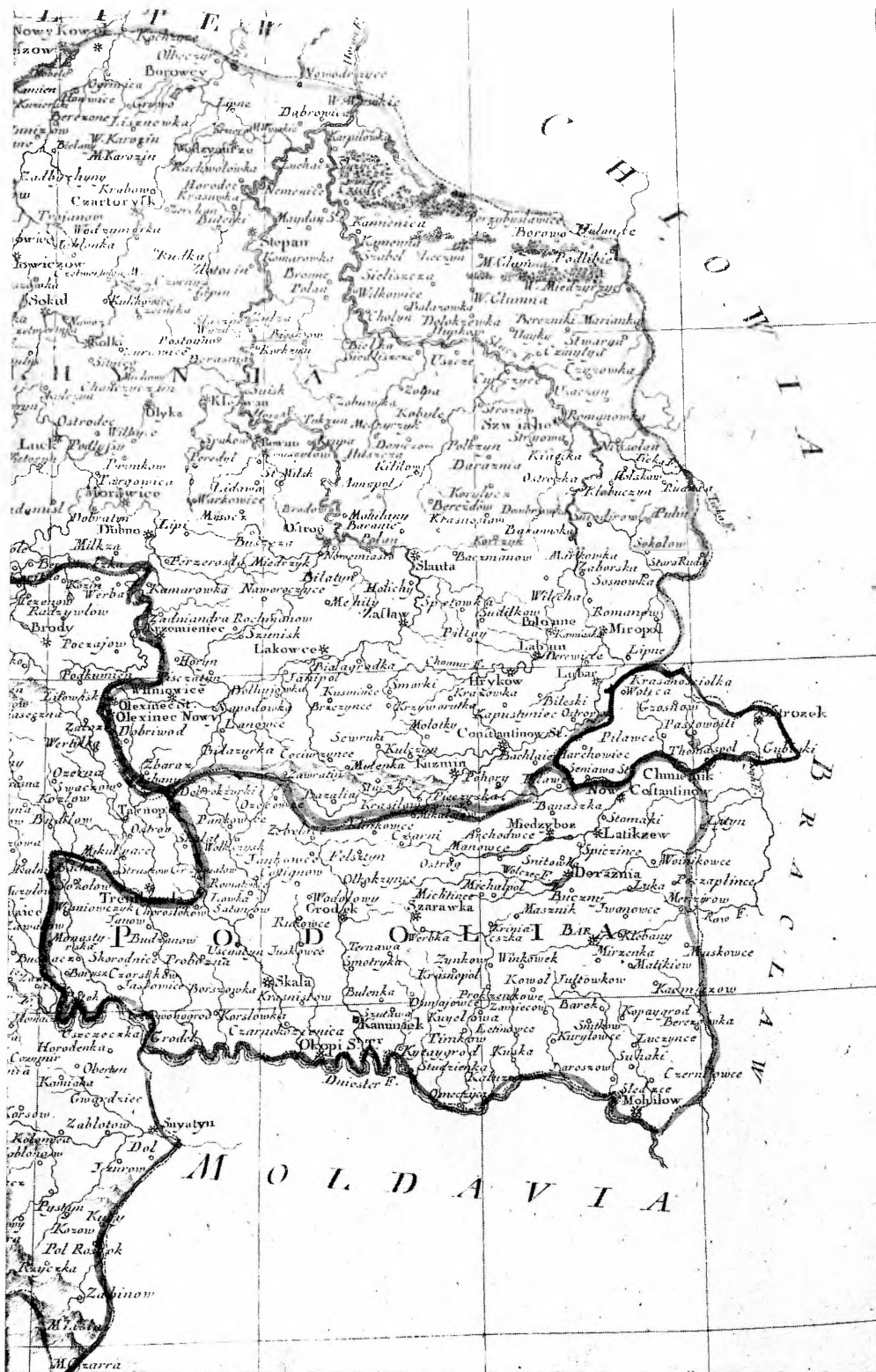
Ucrinae pars: Ucraina cis Borysthenis (Volhynia, Podolia)