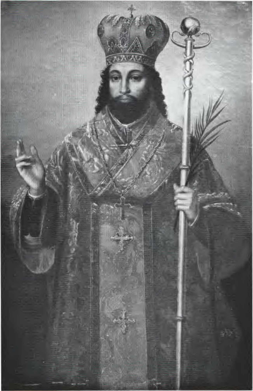
IMAGO S. JOSAPHAT ROMANA ANTE CANONIZATIONEM