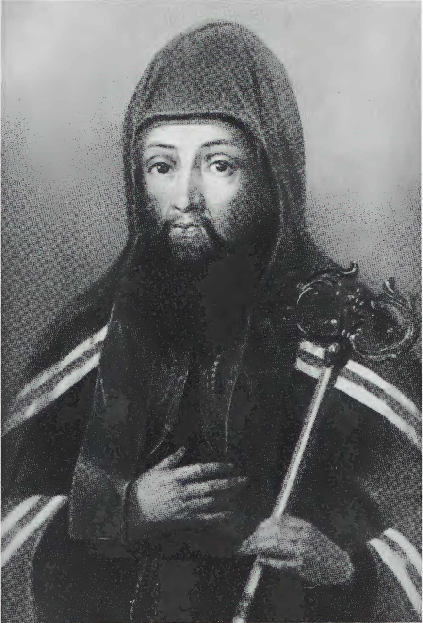
VETUS IMAGO S. JOSAPHAT VILNENSIS