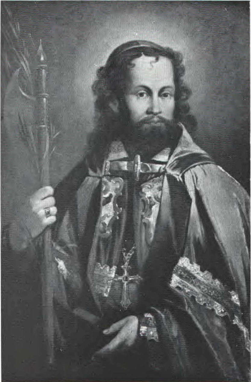
IMAGO S. JOSAPHAT IN ECCLESIA S. ANDREAE IN VALLE ROMAE