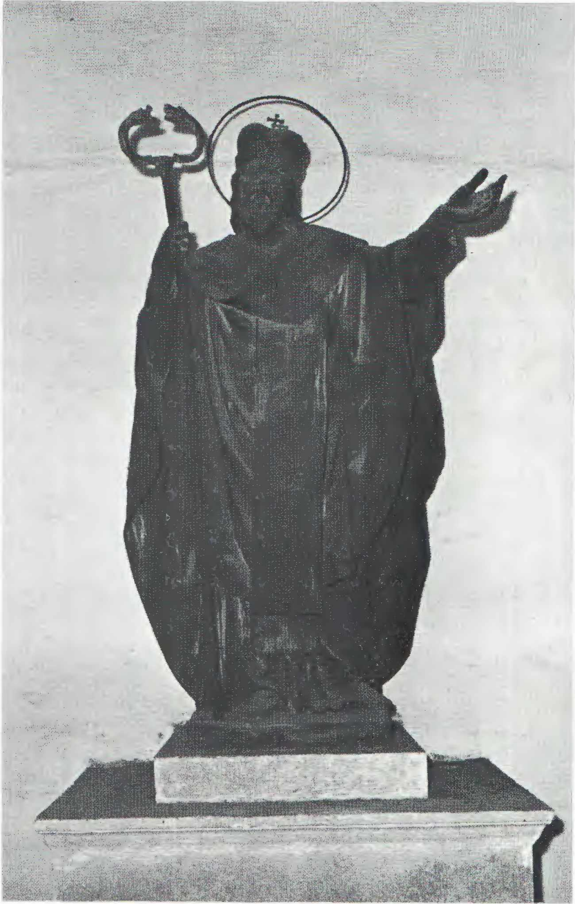
STATUA S. JOSAPHAT IN ARCHIMANDRIA CRYPTAE FERRATAE an. 1867