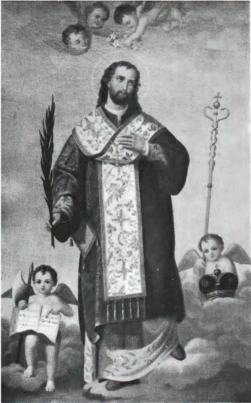
IMAGO S. JOSAPHAT TEMPORE CANONIZATIONIS ОБРАЗ СВ. ЙОСАФАТА З ЧАСІВ КАНОНІЗАЦІЇ