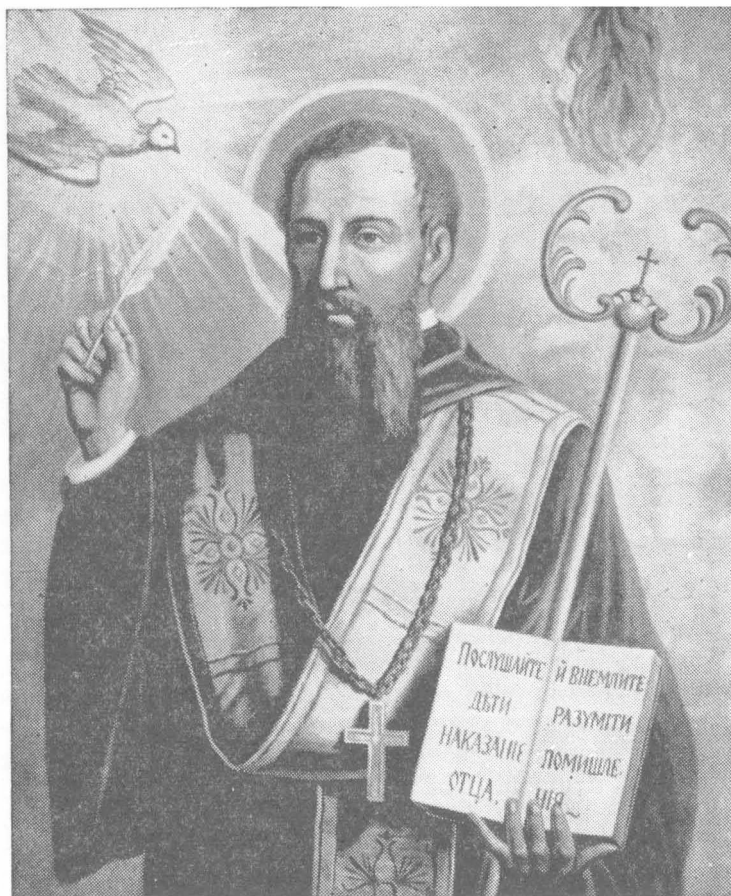
СВЯТИЙ ВАСИЛИЙ ВЕЛИКИЙ, Архиепископ Кесарії Каппадокійської, Отець Східньої Церкви, Патріарх Східного Монашества